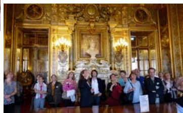
La salle des conférences

Après un déjeuner dans les salons Napoléon, le groupe Nexus a découvert les salles somptueuses allant de la Salle du livre d'or à l'hémicycle, la salle des séances en passant par la bibliothèque, la salle des conférences pour finir par l'escalier d'honneur.