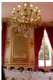
Le salon Napoléon

Lassée du Louvre, la reine et régente Marie de Médicis, mère du jeune Louis XIII achète en 1611 un vaste domaine en lisière de Paris et y fait construire un somptueux palais. En 1793, les révolutionnaires en font une prison. En 1800, le palais est aménagé pour y installer le Sénat conservateur créé par la Constitution de l'an VIII. Depuis 1958, le Sénat a retrouvé son éclat républicain dans le faste des lieux.